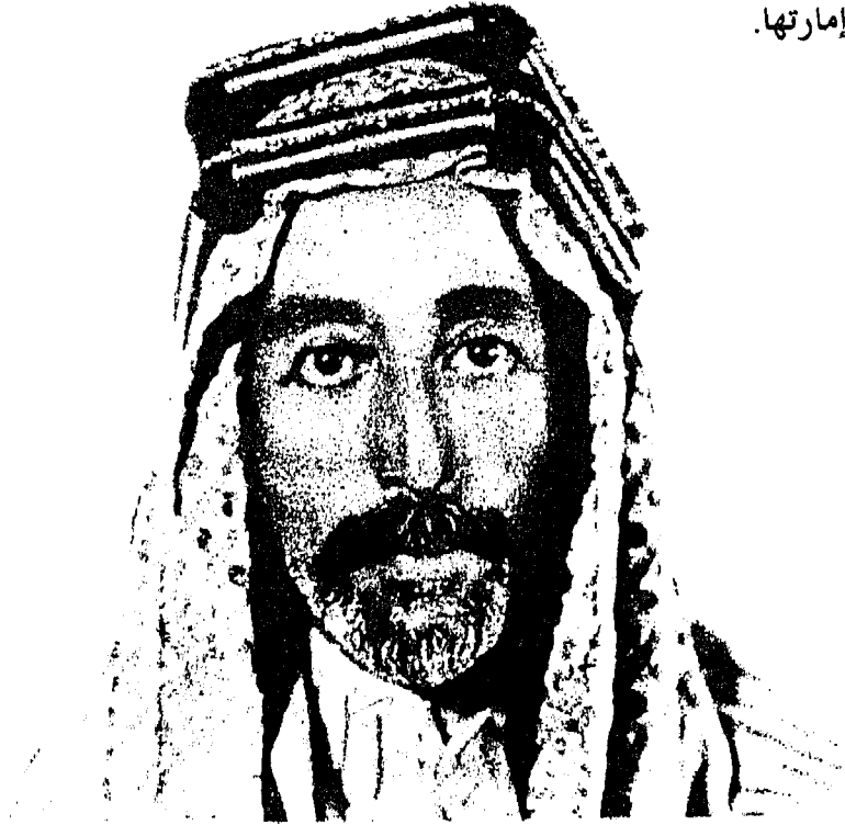
الملك علي ملك الحجاز

أفتى علماء الرياض بأنه لا يجوز دخول "الحرم" بنية القتال. وأذن عبد العزيز بحصار مكة إن قاومت. ودخلها خالد ابن لؤي وسلطان بن بجاد بجيشهما، وكلهم بملابس الإحرام، ينادون بالأمان. وطافوا حول "البيت" وسعوا. ثم تسلموا زمام الأمور، يوم ١٧ ربيع الأول ١٣٤٣ (١٩٢٤م) وتولى خالد إمارتها.